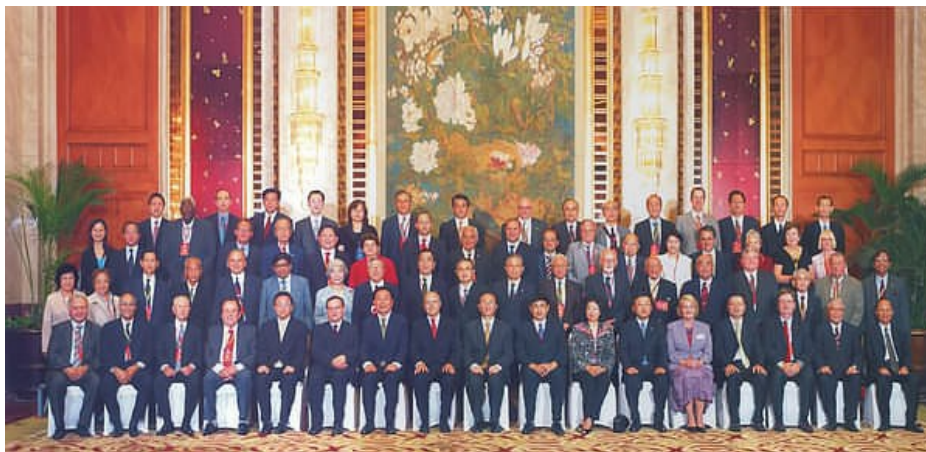
član Političkog biroa Centralnog Komiteta KP Kine i sekretar KP Kine Šangaja, gospodin Chen Liangyu, sa svojim najbližim saradnicima, priredio je svečani prijem za predsednike društava i organizacija koje su prisustvovali proslavi 50 godina Šangajske Narodne Asocijacije za Prijateljstvo sa Stranim Zemljama

Šangajska Narodna Asocijacija za Prijateljstvo sa Stranim Zemljama je septembra 2006. godine proslavila 50 godina postojanja i rada, a tim povodom je organizovala svečanu proslavu ovog jubileja, na koju su pozvani gosti iz više od dvadeset zemalja iz celog sveta. Tokom višednevnog programa u okviru proslave, gosti su se upoznali sa privrednim i društvenim dostignućima Šangaja, obišli važnije objekte i većinu gradskih distrikta, kao i institucije koje deluju i rade u okvirima nadležnosti Vlade Šangaja. Pored prisustva na svim manifestacijama u okviru ove proslave, predstavnici DRUŠTVA DALEKI ISTOK su imali poseban program posete institucijama Šangaja, a dalji boravak u Šangaju je uključio razgovore vezano za plan i program zajedničkih aktivnosti u narednoj godini. Takođe, predstavnici DRUŠTVA DALEKI ISTOK su bili među gostima i na svečanom prijemu koji je povodom Dana republike priredio gospodin Han Zhang, gradonačelnik Šangaja.