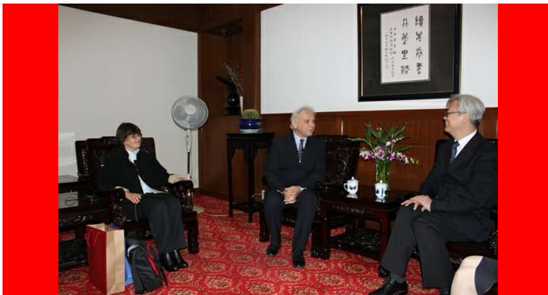
predstavnici DRUŠTVA DALEKI ISTOK na prijemu u Institutu za naučno tehničke informacije Šangaja

Predstavnici DRUŠTVA DALEKI ISTOK su, tokom posete i boravka u Šangaju, imali priliku da se, još jednom, susretnu sa asocijacijom SPAFFC, svojim dugogodišnjim saradnikom i partnerom u međunarodnoj saradnji. Prilikom najnovijeg susreta i razgovora sa najvišim rukovodiocima ove institucije grada Šangaja, istaknuto je da je saradnja dve organizacije, u proteklim godinama, dala odlične rezultate, a da novi planovi i projekti tek treba da potvrde uspešnost prethodnog rada. Dve organizacije su odgovorno pristupile dogovorenim projektima u saradnji koja je rezultirala, pored drugih programa i projekata, još jednim povezivanjem gradova iz Srbije sa Šangajem. Takođe, tokom ove posete je unapređen vid saradnje DRUŠTVA DALEKI ISTOK sa drugim institucijama grada Šangaja, a postavljene su i osnove za neke nove programe u kojima bi učestvovala obe strane. Asocijacija SPAFFC je deo Odeljenja spoljnih poslova Narodne vlade Šangaja i punih 55 godina prestavlja prozor u svet ove kineske metropole. Prilikom ponovnog susreta u Šangaju, predstavnici DRUŠTVA DALEKI ISTOK su asocijaciji SPAFFC uručili posebne plakete DRUŠTVA, kao zahvalnost za dugogodišnju uspešnu saradnju.