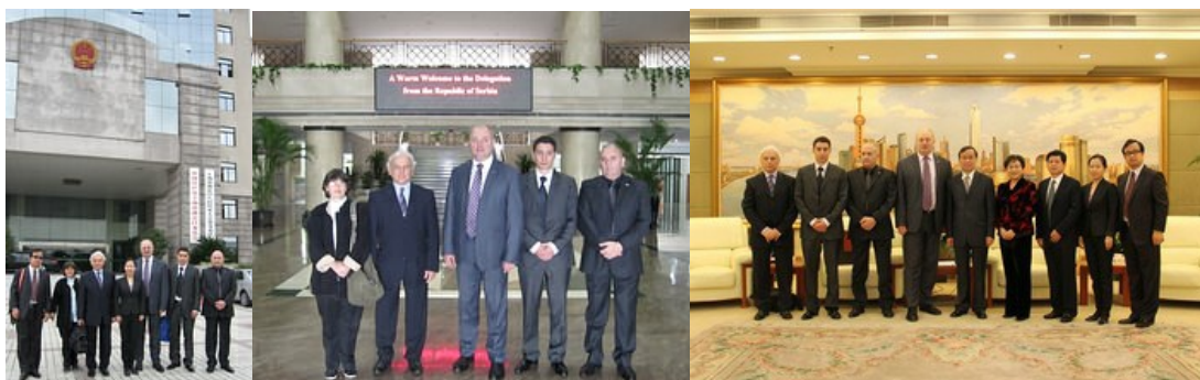
delegacija iz Beograda u distriktu Jiading