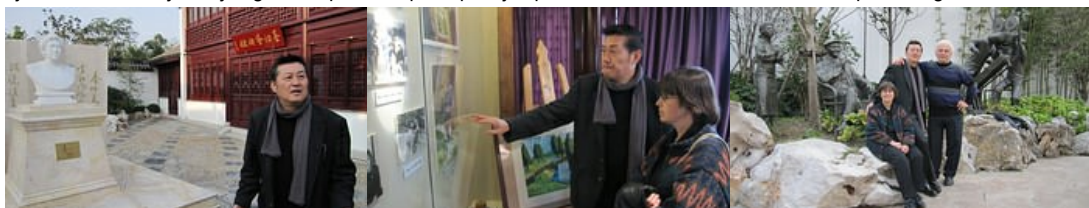
poznati režiser i gosti iz Beograda

Jedan od interesantnih momenata je bila i poseta kući-muzeju poznate glumice Qin Yi, gde je goste dočekaio jedan od najpoznatijih režisera dokumentarnog filma u NR Kini, Tong Ruimin. Ovo je bila izuzetna prilika da se, takoreći, iz prve ruke stekne slika o jednoj od najpoznatijih kineskih glumica, kao i o režiseru koji radi na filmu o njenom životu i radu. Ljubazni domaćin je svojim gostima posvetio punu pažnju i predstavio skoro sve iz života i dela poznate glumice.