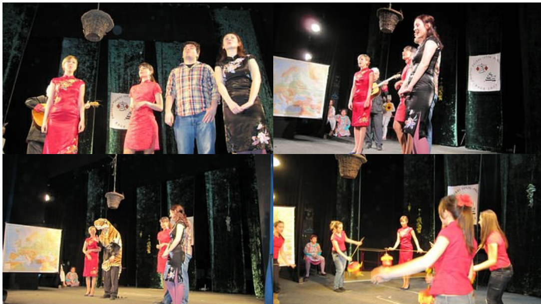
članovi Društva Daleki istok na sceni pozorišta Pinokio u Zemunu