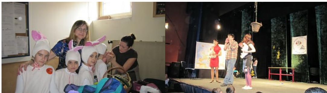
"zečići" se pripremaju dok članovi Društva Daleki istok uveliko zabavljaju publiku

Nastup Društva Daleki istok u pozorištu Pinokio u Zemunu, prvi je nastup za najmlađu publiku, a verovatno je t bila i rva prilika da se malšani koj su bili u sali, upoznaju sa jednim malim delom kineskih tradicija i kulture. Članovi Društva Daleki istok su, još jednom, pokazali svoje poznavanje kineskog jezika i kulture, a u nastupu kojim su dočarali atmosferu kineskih tradicija, upoznali su mališane u publici sa detaljima vezanim za kineski tradicionalni kalendar i godinu koja je nastupila, Godinu Zeca, zatim sa praznovanjem Praznika proleća i Praznika svetiljki, a tokom predstave su naučili mališane i nekoliko reči iz kineskog jezika. Uz pojavu Tigra, koji je predao svoju vlast Zecu, što je dočarano maštovitim skečom u kome su se pojavili i mali zečići, ples crvenih lampiona je publici doneo prikaz praznika kada se u Kini pale crvene svetiljke i time, na dan prvog punog meseca u Novoj godni, obeležava završetak novogodišnjeg slavlja.