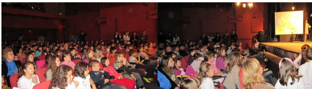
sala u pozorištu Pinokio je bila ispunjena do poslednjeg mesta

Nastup Društva Daleki istok u pozorištu Pinokio u Zemunu, prvi je nastup za najmlađu publiku, a verovatno je t bila i rva prilika da se malšani koj su bili u sali, upoznaju sa jednim malim delom kineskih tradicija i kulture. Članovi Društva Daleki istok su, još jednom, pokazali svoje poznavanje kineskog jezika i kulture, a u nastupu kojim su dočarali atmosferu kineskih tradicija, upoznali su mališane u publici sa detaljima vezanim za kineski tradicionalni kalendar i godinu koja je nastupila, Godinu Zeca, zatim sa praznovanjem Praznika proleća i Praznika svetiljki, a tokom predstave su naučili mališane i nekoliko reči iz kineskog jezika. Uz pojavu Tigra, koji je predao svoju vlast Zecu, što je dočarano maštovitim skečom u kome su se pojavili i mali zečići, ples crvenih lampiona je publici doneo prikaz praznika kada se u Kini pale crvene svetiljke i time, na dan prvog punog meseca u Novoj godni, obeležava završetak novogodišnjeg slavlja.