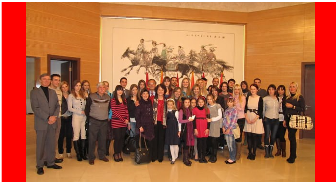
članovi DRUŠTVA DALEKI ISTOK sa ambasadorom NR Kine i njegovom suprugom