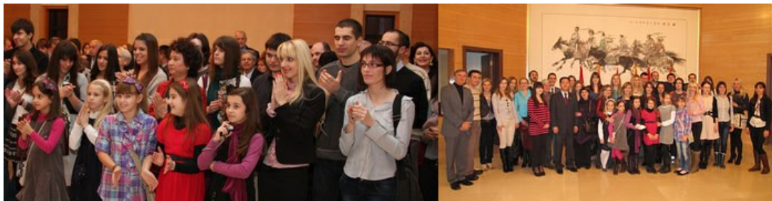
članovi DRUŠTVA DALEKI ISTOK prate govor ambasadora i zajednička fotografija sa prvim sekretarom ambasade NR Kine, Chi Lingjun