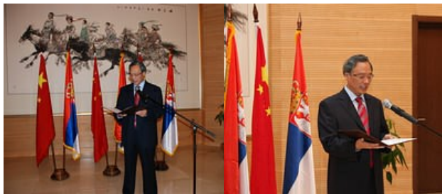
na slikama levo: njegova ekselencija, ambasador Narodne Republike Kine u Republici Srbiji, g. Zhang Wanxue, pozdravio je prisutne na početku prijema