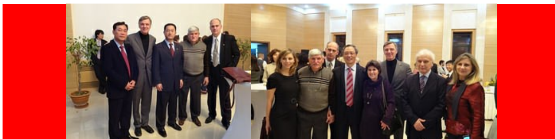
članovi Društva sa savetnikom za kulturu i nj. e. ambasadorom