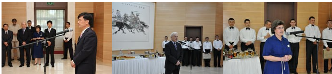
pozdravne reči ambasadora NR Kine, predsednika i osnivača DRUŠTVA DALEKI ISTOK