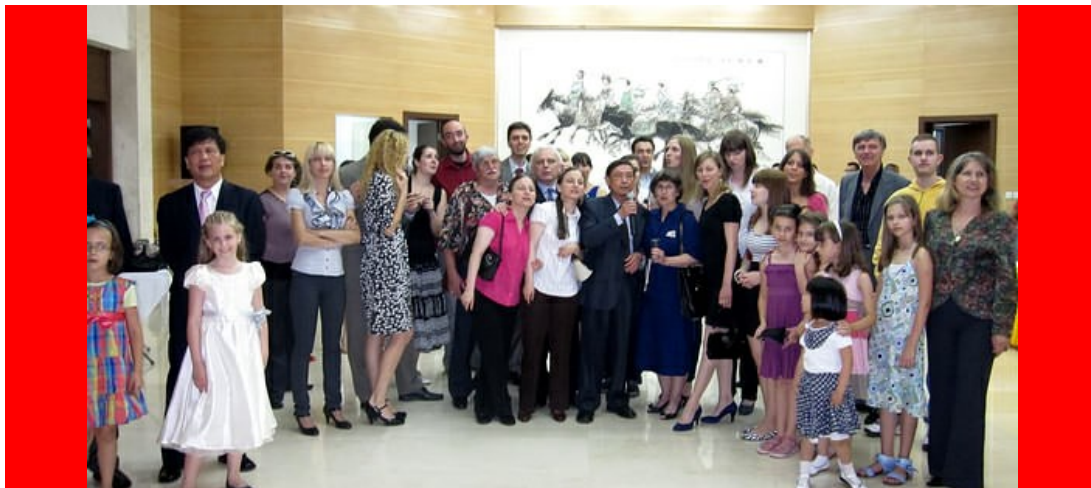
deo atmosfere na prijemu u ambasadi NR Kine