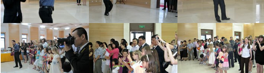
domaćini i gosti su zajedno izveli nekoliko tačaka u okviru zabavnog dela večeri