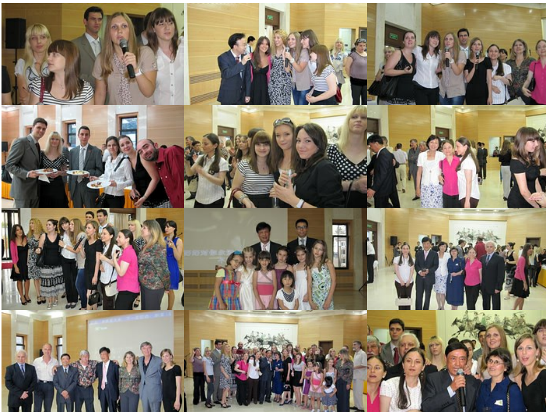
specijaliteti kineske kuhinje, druženje, neizbežne karaoke, prilika za zajedničke fotografije, .....