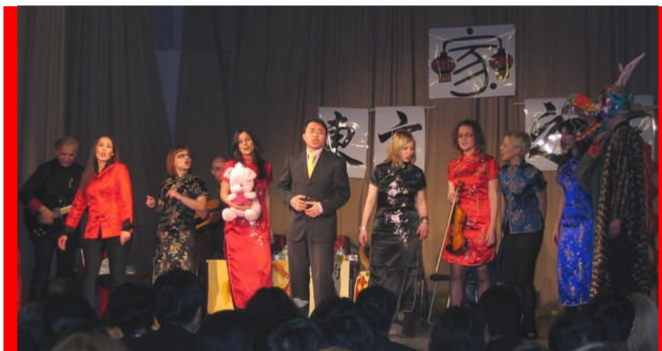
članovi DRUŠTVA DALEKI ISTOK su izveli izvanredan program za goste na svečanoj proslavi Praznika proleća