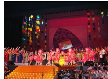
deca iz Šangaja na otvaranju festivala "Radost Evrope" u Beogradu, u Nišu, i na Gala koncertu u Sava Centru

Tokom boravka na "Radost Evrope 2007", deca iz Šangaja su učestvovala i u mini festivalu koji je održan u Nišu, kao i u svečanosti povodom Dana škole "Ivo Andrić", a u pratnji i druženju sa svojim domaćinima, obišla su Beograd i upoznala glavni grad Srbije, o kome su do sada samo slušala od svojih vršnjaka iz Centra za mlade Šangaja, koji su imali priliku da borave u Srbiji i Beogradu u okviru programa koje su realizovali DRUŠTVO DALEKI ISTOK i Šangajska Narodna Asocijacija za Prijateljstvo sa Stranim Zemljama (SPAFFC).