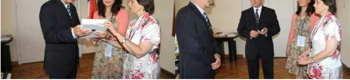
razgovor sa ministrom Petkovićem