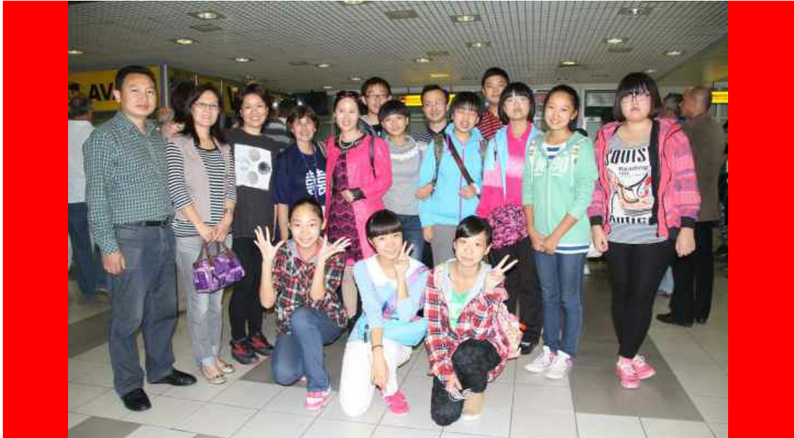
doček delegacije i dece iz prvincije Henan na beogradskom aerodromu

Tokom boravka u Beogradu, članovi delegacije institucija Narodne vlade provincije Henan i predstavnici DRUŠTVA DALEKI ISTOK su imali priliku da razmene brojna iskustva vezano za međunarodnu saradnju, uz predloge za proširenje interesovanja za nove zajedničke aktivnosti u narednom periodu. Članovi delegacije su, istovremeno, preneli DRUŠTVU DALEKI ISTOK pozdrave institucija Narodne vlade provincije Henan i Henan Experimental High School, uz veliku zahvalnost za angažovanje DRUŠTVA DALEKI ISTOK kako bi deca iz provincije Henan i ove škole, bila gost na 43. dečjem festivalu "Radost Evrope". Gospođa Zhang Wei, kao i ostali članovi delegacije, oduševljena je boravkom u Beogradu, a to su potvrdili i učenici koji su se sa suzama u očima i uz plač, opraštali od svojih vršnjaka i novih drugara iz Osnovne škole "Milan Đ. Milićević".