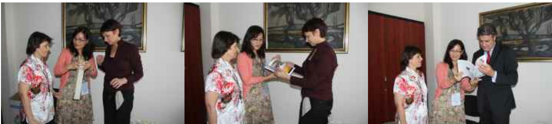
na razgovorima u Skupštini grada Beograda

DRUŠTVO DALEKI ISTOK je, uvažavajući želju Dečjeg kulturnog centra Beograd da na ovogodišnjem festivalu "Radost Evrope" učestvuju i deca iz NR Kine, učinilo sve da se ta želja i ostvari. Zahvaljujući saradnji sa institucijama Narodne vlade provincije Henan, DRUŠTVO DALEKI ISTOK je uspelo da na "Radost Evrope" dovede učenike Henan Experimental High School, koji su bili gosti Osnovne škole "Milan Đ. Miličević" i učenika te beogradske škole. Zahvaljujući izuzetnom domaćinstvu koje su pokazali direktor i svi zaposleni u ovoj školi, kao i đacima domaćinima i njihovim roditeljima, deca iz NR Kine su provela nekoliko, po njihovim rečima, prelepih dana u Beogradu. Takođe, izuzetno nadahnut program dečjeg festivala "Radost Evrope" je ostavio dubok utisak na goste iz NR Kine, koji su prvi put učestvovali na jednom ovakvom događaju. Sve u svemu, Beograd će ostati u lepoj uspomeni malim Kinezima, a njihovi domaćini već snivaju trenutak kada će uzvratiti posetu i upoznati zemlju i grad svojih dojučerašnjih gostiju, a sada dobrih drugara i prijatelja.