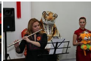
članovi DRUŠTVA DALEKI ISTOK i polaznici Škole kineskog jezika .....