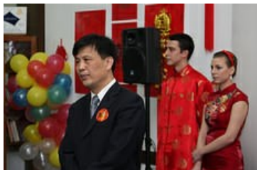
ambasador Wei Jinghua