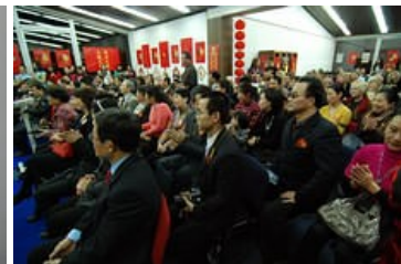
gosti na svečanosti