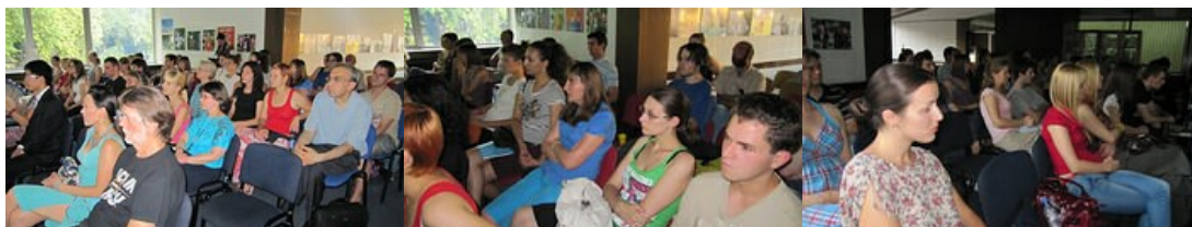
prisutni su pažljivo pratili izlaganje o starokineskoj matematici

U prvoj polovini 2010. godine, Biblioteka Šangaja i Biblioteka distrikta Changning, organizovale su takmičenje u pisanim radovima pod nazivom 2010 Shanghai Get-together, na temu Kina i kineska kultura, ili na temu sadržaja neke pročitane knjige iz kolekcije "Prozora Šangaja". Posetioci i učesnici u aktivnostima "Prozora Šangaja" u Beogradu su poslali najviše radova, a i dobili najviše nagrada. Drugi rad po vrednosti po oceni stručnog žirija u Šangaju, kao i dva rada koji su ocenjeni kao treći po vrednosti, pripali su učesnicima takmičenja iz Beograda, tako da je "Prozor Šangaja" u Beogradu, bio najzastupljeniji u poslatim radovima, ali i sa najviše nagrađenih radova. Na ovoj večeri, nagrađenima a i svim drugim učesnicima u ovom takmičenju, uručena je knjiga sa svim radovima koji su prispeli na 2010 Shanghai Get-together takmičenje, a koju je izdala Biblioteka Šangaja, zajedno sa Bibliotekom distrikta Changning.