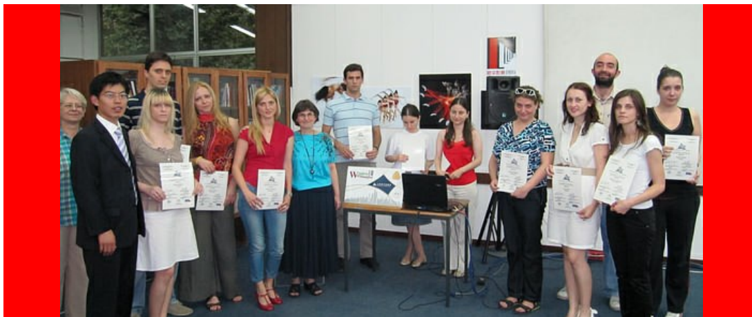
uručenje diploma polaznicima Škole kineskog jezika u Kulturnom centru "Prozor Šangaja"

Veče o starokineskoj matematici je pripremila prof. dr Vesna Jevremović, profesor na Matematičkom fakultetu u Beogradu, a to je bila prilika da se prisutni upoznaju sa matematikom i računanjem u vreme stare Kine, kao i sa matematičkim postavkama i zadacima koji su u to vreme postojali, a za koje se, mnogo kasnije, saznalo i u drugim delovima sveta. Samo izlaganje je praćeno izuzetno pažljivo obzirom da su većinu prisutnih na ovoj večeri činili studenti, među kojima i polaznici Škole kineskog jezika u okviru rada Kulturnog centra "Prozor Šangaja".