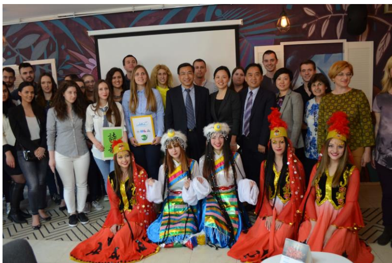
U Domu kulture Studentski grad