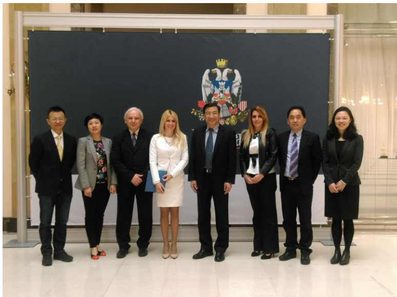
Prijem u Skupštini grada Beograda

priliku posebno pripremljen. „Ovo je bila izuzetna prilika da se još jednom uverimo u to da je uloženi veliki trud kako bi se Šangaj i Kina predstavili u najboljem svetlu u Srbiji. Od svih programa koji su pod nazivom „Prozor Šangaja“ pokrenuti u više od 60 zemalja širom sveta, najuspešniji je program koji se odvija u Beogradu, u Srbiji. Hvala vam puno“, rekao je g. Ye Ruqiang.